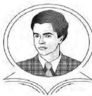
БИБЛИОТЕКА "БОРКА ТАЛЕСКИ" - ПРИЛЕП